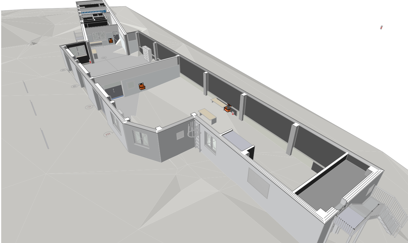
SCHEMATICKÝ 3D REZ